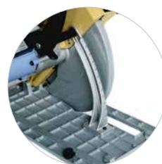
Diepteverstelling met schaalverdeling