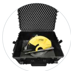
Optioneel: Transportkoffer met wielen Art. 60827Box