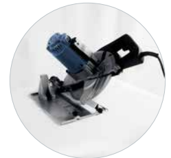
45° Schuin zagen