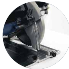
Diepteverstelling met schaalverdeling