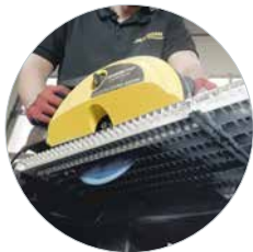
Ideaal voor roosters met schokbestendig LBS-zaagblad Art.: 608295LBS