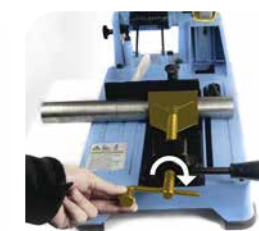
2. Das zu sägende Material wird mit der Spindel fixiert (einmaliger Vorgang).