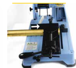
4. Das nächste Werkstück wird in die zu sägende Position gebracht.