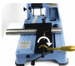
5. Hebel nach rechts und Sägevorgang starten: nächste Schritte: 3 - 4 - 5.