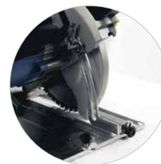
Diepteverstelling met schaalverdeling