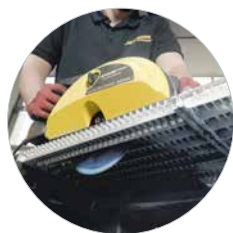
Ideaal voor roosters met schokbestendig LBS-zaagblad Art.Nr. 608100LBS