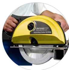
Zaagdiepte tot 82 mm