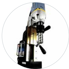
Hoogteverschillen zijn snel aan te passen