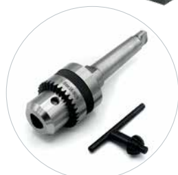
Option: Mandrin 16 mm et adaptateur Réf. 490164