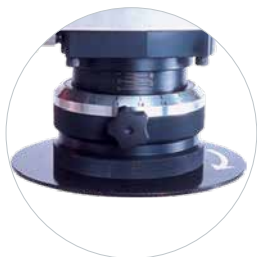
Werkzeuglos höhenverstellbare Phase & einstellbare Skalierung