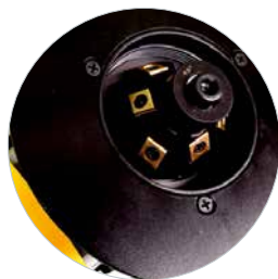
inkl. 45° Werkzeugaufnahme