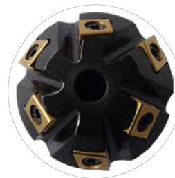
Anfasen und Entgraten ab 30 mm Innendurchmesser