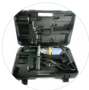
Lieferung im Koffer