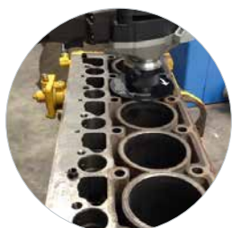
Ideaal voor het ontbramen en afkanten van rondingen en gaten afschuiven van laskanten op 30° en 45°