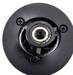
Gereedschapsopname met 3 snijplaatjes