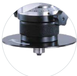
Traploos instelbare freeshoogte, instelbare schaal