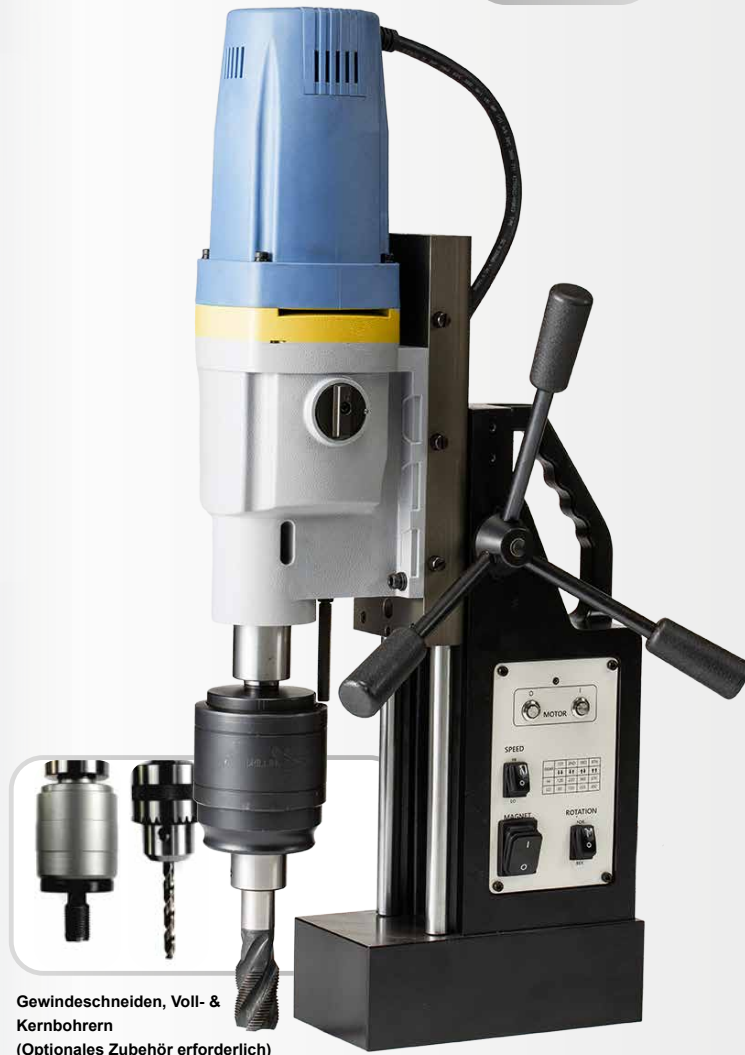
Gewindeschneiden, Voll- & Kernbohren (Optionales Zubehör erforderlich)