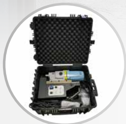
Lieferung im Transportkoffer mit Zubehör