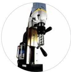
Hoogteverschillen zijn snel aan te passen