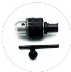
Optioneel: boorkop 13 mm & Adapter voor direct inzet in snelspanopname Artikel 490152A