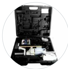
Levering in koffer