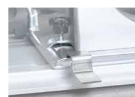
Set met 2 adapters Art.Nr. 608275A