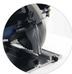
Diepteverstelling met schaalverdeling