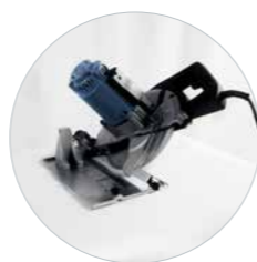
45° Schuin zagen