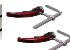
2 snelspanklemmen Art.Nr. 608275S