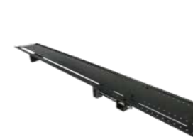
Verstellbare geleiderail met geïntegreerd klemsysteem Art.Nr. 608284