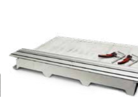
Geleiderail SET Lengte 1.400 mm Incl. 2 snelspanners Incl. 2 adapters (608275A) Art.Nr. 608275ASET