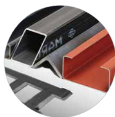
Zaagt plaatwerk tot 10 mm en sandwichpanelen en profielen met een zaagdiepte tot 82 mm