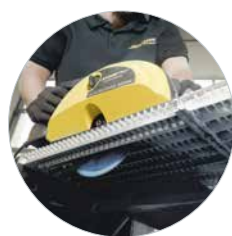
Ideaal voor roosters met schokbestendig LBS-zaagblad Art.: 608280LBS