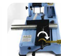
5. Hebel nach rechts und Sägevorgang starten: nächste Schritte: 3 - 4 - 5.