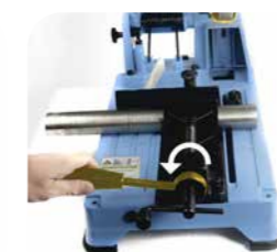
3. Nach dem Schnitt wird der Schnellspannhebel auf die linke Seite gelegt.