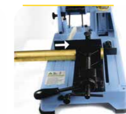
4. Das nächste Werkstück wird in die zu sägende Position gebracht.