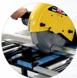
Premium Super Dry Cutter 9435 et lame en action