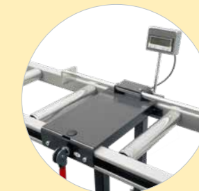
Variante B: DIGITALE, avec butée digitale millimétrique Réf. 609960B