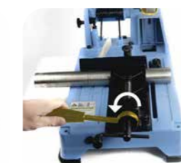
3. Après la coupe, la poignée de dégagement rapide à tourner vers la gauche.