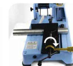
5. Tourner la poignée de dégagement rapide vers la droite et ensuite revenir aux étapes: 3 - 4 - 5.