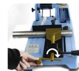
2. Verrouiller le matériau à scier avec la petite poignée (une fois par production).