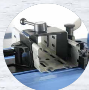
Thinfix - Système pour profilés ouverts Réf. 600546