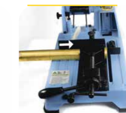
4. Diriger la pièce vers la butée.