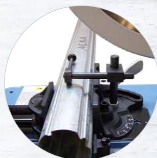
Idéal pour le sciage des tubes de volet roulant avec le système de serrage excentrique Réf. 609910