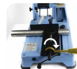
1. Position de départ: La poignée de dégagement rapide est tournée vers la droite.