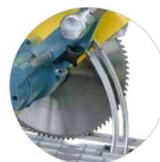
Diepteverstelling met schaalverdeling