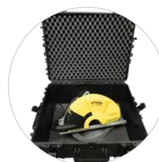
Incl. Transportkoffer met wielen