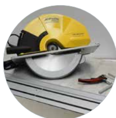
SHDC met geleiderailset