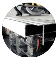
Geleiderail 1.400 mm met 2 snelspanklemmen