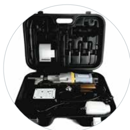
Geleverd met koffer

Veiligheidsketting, koelvloeistoftank, gereedschap, spaanbescherming, uitwerpig, koffer, MK3 / Weldon 19