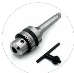
Optioneel: boorkop 16 mm en adapter Art. 490164