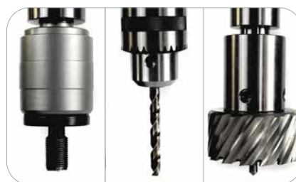
Draadsnijden, spiraal- en kernboren (Accessoires zijn mogelijk vereist)