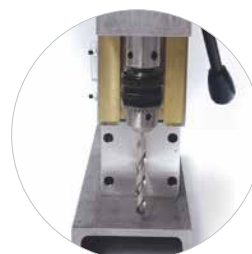
Option: mandrin 13 mm avec adaptateur pour forets