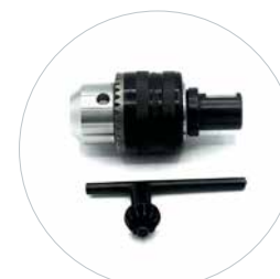
Option: Mandrin 13 mm avec adaptateur Weldon Réf. 490152A