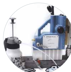
Livrée avec chaîne de sécurité, outils et système de lubrification sous pression externe